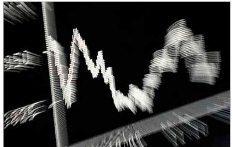
Mit CFD können Anleger von den Kursschwankungen profitieren.